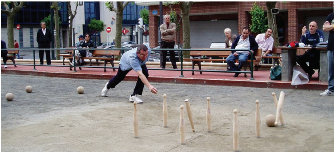
Inazio deuna auzoko bolatokia • Bolera de San Ignacio . Bilbao.

remonte con muna entre los bolaris del Duranguésado y el nacimiento de clubes como el club Nervión de Basauri de bolo burgalés.