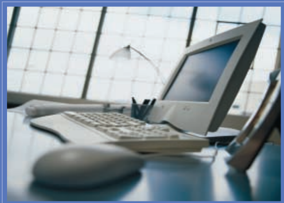
Teknologia berriak / Nuevas tecnologías