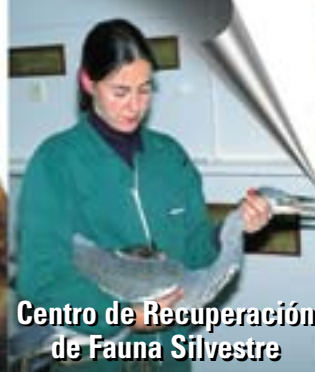
Centro de Recuperación de Fauna Silvestre