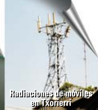
Radiaciones de móviles en Txorierrí