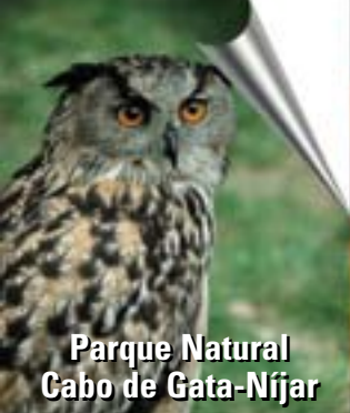
Parque Natural Cabo de Gata-Níjar