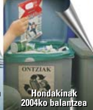
Hondakinak 2004ko balantzea