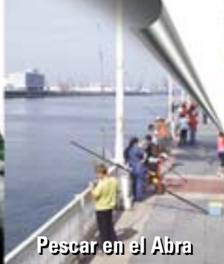
Pescar en el Abra