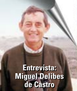
Entrevista: Miguel Delibes de Castro