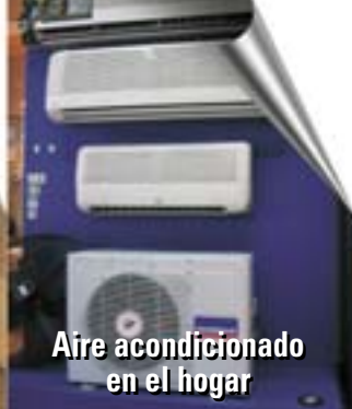
Aire acondicionado en el hogar