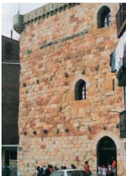
Bermeo. Torre de Ertzilla

Los Parientes Mayores desaparecieron en aquel tiempo porque su función también desaparecerá, aunque siguieron denominándose durante algún tiempo. Su existencia formal se dilató en el tiempo, mientras pervivieron sus mayorazgos, pero no serán el referente de su linaje ni tampoco encabezarán huestes armadas, a pesar de que sigan detentando títulos y, como en el pasado, esté en sus manos la mayor parte del poder económico.