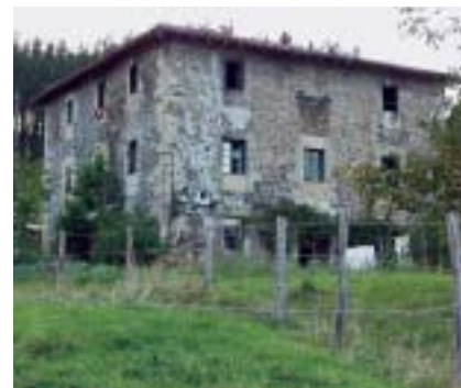
Etxebarri. Torre Manozka.