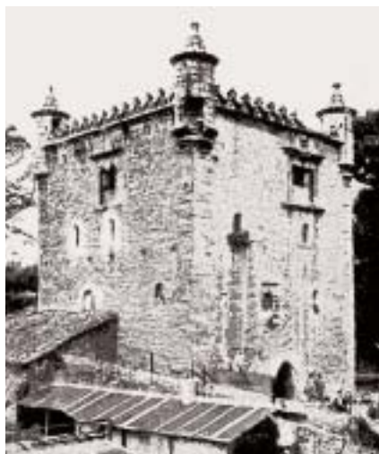
Sestao. La desaparecida torre de Sestao enmarcaba entre sus cubos la crestería, única por su belleza entre las torres bizkainas.

Al comienzo debieron ser de pequeño tamaño, sin mayores accesorios que la propia divisa o cuartel, ya que los primeros escudos se limitaban a una cruz o una simple figura. En las torres más antiguas, el escudo carece de yelmos u otros elementos que lo adornen; con el paso del tiempo se recargó cada vez más, modificándose en la misma medida que lo hizo la torre, que pasó de escueto torreón a ser una torre-palacio. En algunos casos, el tamaño desmesurado del escudo y la importancia que adquiere en el conjunto del edificio indica bien a las claras la fatua pretensión de sus dueños de mostrar, a través de su exageración, su privilegiada posición social.