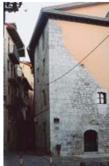
Lekeitio. Torre de Leniz.