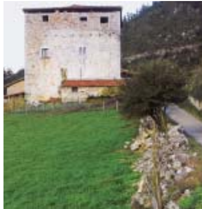
Markina. Torre de Barroeta. A la derecha se ha recreado el aspecto que ofrecería la misma torre con sus cadahalsos.

Según esta descripción, debemos imaginarnos a las torres más antiguas como un edificio trabajado a cal y canto, con numerosos voladizos de madera en forma de matacanes y cadahalsos ampliamente aspillerados y con cubos y almenas, aunque a faltas de troneras (que aparecerían con el uso de las armas de fuego).