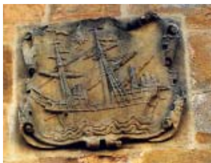
Plentzia. El escudo de la villa labrado en una de las paredes del Torreón.