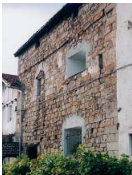
Erandio. Asua. Torresarre.