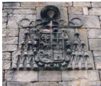
Karrantza. Ahedo. Escudo del Palacio-colegio del arzobispo Diego de Ahedo. Construido a partir de la primera mitad del XVII.