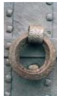
Abadiño. Torre de Muntzaraz. El edificio se divide en dos partes claramente diferenciadas. De un lado la torre original, gótica, con muros de sillería que alcanzan los 2,70 metros de grosor, clara expresión de las necesidades defensivas existentes al tiempo de su construcción. La parte superior, resultado de reformas posteriores, contrasta poderosamente por su aspecto, mucho más airoso gracias a su "loggia" o solana de gusto renacentista italiano, con arcos de medio punto sobre columnas toscanas de basa ática. Sobre ella se apoya un tejado a cuatro vertientes. El escudo sobre el dintel de la entrada es de una época posterior a la torre primitiva. Coincide, posiblemente, con la reforma de los pisos superiores. La puerta conserva una aldaba gótica.