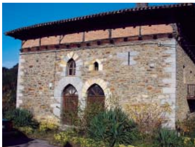
Zeberio. Torre de Areiltza.