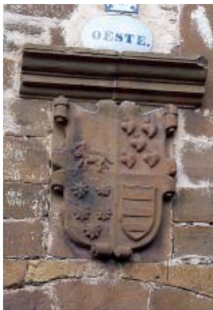
Galdames. Escudo sobre el acceso a la torre de Ibarruri.