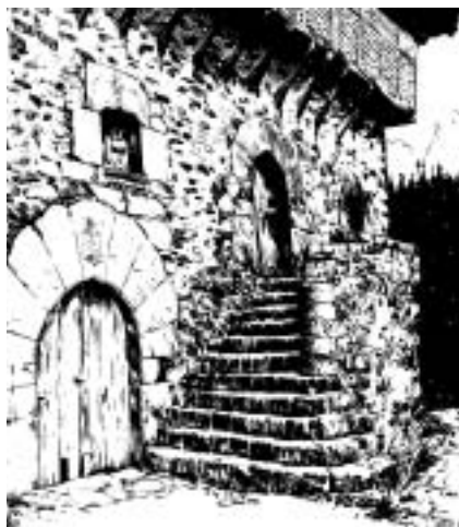
Orozko. Casa-palacio de Aranguren.

Los nuevos usos supusieron, tanto en lo arquitectónico como en lo social, un cambio respecto a la etapa anterior, mucho más manifiesto en la arquitectura palaciega que en la religiosa o la rural.