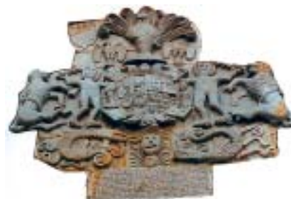
Zalla. Torre de Murga. Algunos escudos llevan labrado un lema o leyenda, generalmente exaltando el apellido con una rima, en ocasiones, muy forzada. El de Murga dice: "Saucos y panelas son / estas armas sin eduvio / hijas del conde don Rubio / nietas del Rey de León".