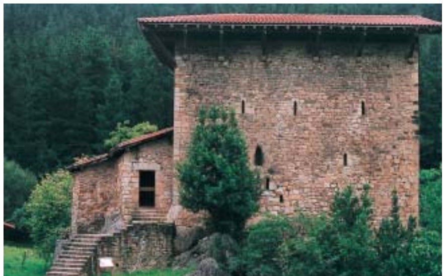
Izurtza. Torre de Etxaburu. Su antigüedad se sumerge en la leyenda, que la lleva a tiempos del emperador romano Antonio Pío, para ser más tarde demolida por el visigodo Ataulfo. Tras ser levantada nuevamente, la terminó destruyendo la Hermandad de Bizkaia. La última reedificación debió ser la realizada en el siglo XVI por Sancho López de Ibañen y su mujer Estibalitz de Etxaburu.