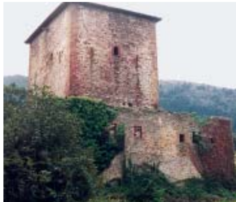
Gúeñes. Torre de la Quadra.