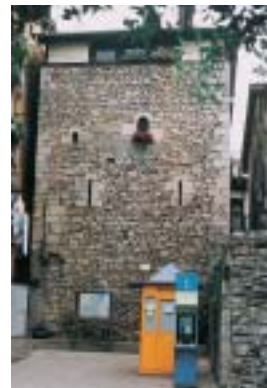
Markina. Torres de Antxia y Ansotegi. Incrustadas en pleno casco urbano salta a la vista su carácter residencial, resaltado por la amplia galería de ventanas que tienen dispuestas a lo largo de toda su fachada. Son palacios urbanos del XVI, a los que el balcón que sobresale de la fachada a la altura del tercer piso, trabajado en madera en su momento, prestaría ligereza y colorido. Las ménsulas servirían, precisamente, como apoyos para los jabalcones que debían sustentar la balconada.