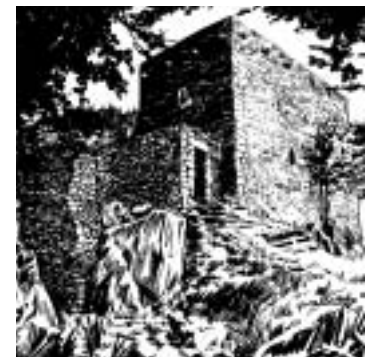
Izurtza. Torre de Etxaburu. Dominando desde su privilegiada situación el camino que lleva desde Urkiola a Durango, en otro tiempo más cercano a ella. También protegía a las ferrerías existentes en las orillas del río Mañaria.