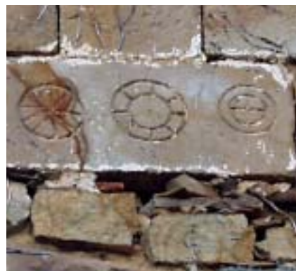
Artzentales. Torre de Traslaviña. Uno de los motivos decorativos más frecuentes es el formado por estelas discoideas.