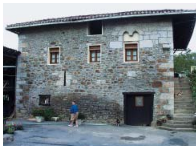
Gaztelu-Elexabeitia. Torre de Castillo.