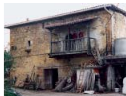
Karrantza. Torre de San Esteban.