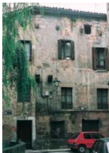
Durango. Torre de Lariz. En ella se aposentó la reina Isabel la Católica cuando visitó la villa en el año 1483, lo que hace suponer que fuese la más importante y gallarda de cuantas se hallaban en la villa y sus alrededores.