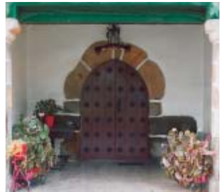
Martzana. Acceso gótico de la torre de Martzana, uno de los escasos elementos mantenidos por la remodelación efectuada a comienzos del siglo XX (debajo).

Hasta su desaparición, y por las características apuntadas, los mayorazgos otorgaron a sus dueños un notorio prestigio social. A fin de cuentas, sus poderes económicos no estaban al alcance de la mayoría.