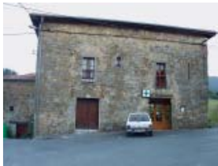
Artzentales. Torre de Traslaviña.

El mayorazgo podía fundarse de forma expresa o incluyendo su creación en la última voluntad o testamento del otorgante. La fórmula era sencilla. Primero se especificaban una serie de consideraciones o razones que movían al fundador del mayorazgo a su creación. Éstas iban desde ser una respuesta a la "demanda divina y humana" hasta otras más reales como el engrandecimiento de la casa y linaje de quien lo creaba.