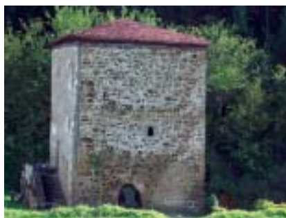
Mungia. Torre Villela. La actual torre de Villela, hoy habilitada como casa de cultura, poco tiene que ver con el antiguo baluarte militar que fue en el pasado. Cuando los marqueses de Cancelada decidieron su restauración, a finales del siglo XIX, solo quedaba una torre almenada y un muro exterior casi derruido. De esta casa descendió Luis de Villela, primer presidente de Méjico..