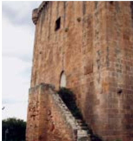
Erandio. Torre de Martiartu.

A continuación se efectuaba una relación de los bienes que se deseaba someter a éste vínculo, y se terminaba estableciendo una línea de sucesión en las propiedades vinculadas.