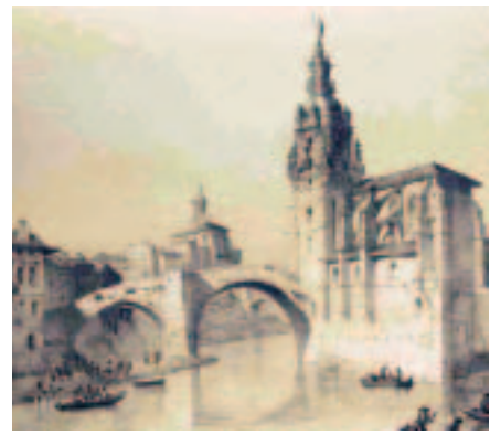
Bilbao, San Antón; por Pérez de Castro.

El duque aceptó mantener y cumplir las condiciones.