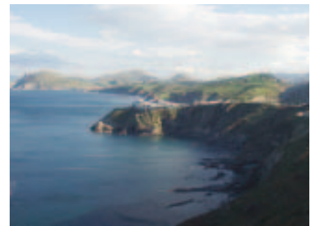
Costa de Bizkaia. Somorrostro.

5º. Plantea que las franquezas, libre comercio, etc, de Bizkaia, se debían en realidad a que la tierra era tan pobre que, para que pudiese mantenerse, el señor le otorgaba privilegios, pues "es de justicia dar remedio a las necesidades públicas".