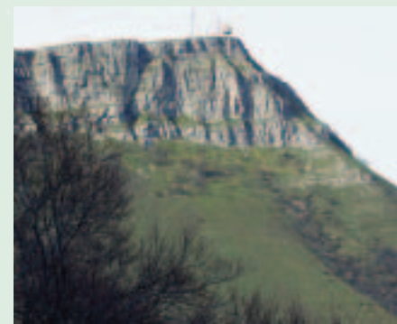
La peña de Urduña.

Después de la mengua o cercenamiento de los distintos fueros existentes llegó el turno de las aduanas.