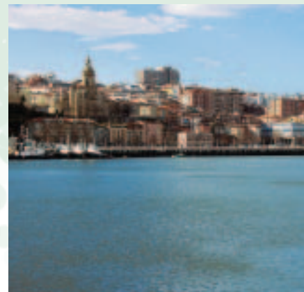
Portugaleta. Vista desde Getxo.

En Bermeo los acontecimientos revistieron mayor gravedad, ya que la multitud, dio muerte a seis vecinos de la villa a los que, como en el