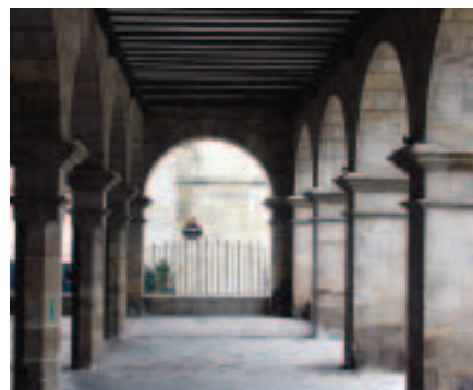
Balmaseda, la otra aduana. Soportales del Ayuntamiento.

Para esto no se discurre medio que no sea de grave embarazo porque aunque las Provincias se convniesen se opondrán las Naciones que en Bilbao ay de todas, y en Navarra franceses, que unos y otros no permitirán el registro, cuyo punto es necesario se trate con refección a los tratados de Paz, porque parece se puede oponer la libre facultad del comercio dispuesto en ellos..."