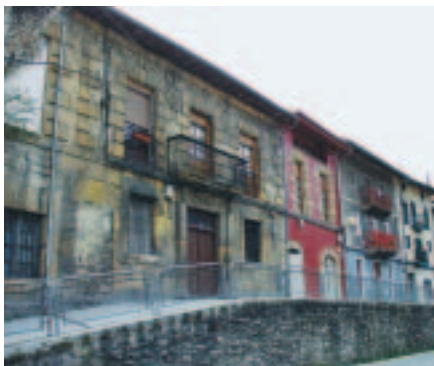
Bizkaia. Ermua, villa fronteriza con Gipuzkoa, territorio que sufrió los mismos problemas que Bizkaia con el traslado aduanero.

totalmente apartados de la razón, sino que son ofensivos al decoro y autoridad real; y V.S. con su prudencia hará reflexión, qué diría el Mundo en vista de que los vasallos, que en tantas ocasiones an savido con distinción y gloria acreditar su zelo y amor al Rey: ahora en la coyuntura más crítica y en un tiempo que está empeñado a defender su Justa causa, le insultan esos mismos vasallos..."