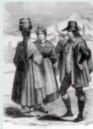
Bizkainos, por Calixto Ortega.

atención y observación de sus fueros, se pusieron las aduanas en los lugares mencionados de Urduña y Balmaseda como términos y extremos de mi territorio y en ellos se han conservado siempre por ser los más adecuados para la satisfacción y percepción de los Reales derechos en todos los géneros que necesariamente se transitan por ellos a las partes de las Castillas y demás Dominios de V.M. sin que jamás se ayan situado las mencionadas Aduanas en los Puertos de Bilbao o Portugalete ni en otro alguno del zentro de este territorio por haverse contemplado y considerado la repugnancia a mis fueros y que mis hixos vendrían a comprenderse en el punto general de las contribuciones, derechos, y pedidos, privándoles de la prerrogativa más substancial, y de el más Onrroso distintivo, libertad y exemption, buenos usos y costumbres de que siempre han gozado, de el más vibo estímulo para concurrir Voluntarios en todas las Urgencias de la Monarchia y a V.M. en el tiempo feliz de su Reinado con repetidos Donativos graciosos..." Vizcaya 8 de Noviembre de 1717.