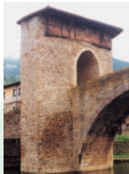
Balmaseda. Puente y aduana de los productos que llegaban a la villa.