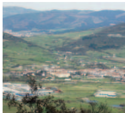
Urduña, histórica aduana del Señorío. Más allá, Amurrio, y al fondo las montañas de Bizkaia.

El plan de Lorenzo de las Veneras también contemplaba los problemas que surgirían en Navarra, pero a éstos les adivinaba mejor término. La propuesta era quitar las Aduanas de Logroño, Agreda, Alfaro, y ponerlos en la misma frontera con Francia y un rediezmo en Pamplona "lo qual aunque tienen privilegios sería fácil de conseguir manejándolo diestramente por las conveniencias que se les siguen a los Navarros..."