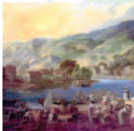
Arenal de Bilbao; por Paret.

"...se digne V.A. comprender el sentimiento que me queda de no poder complacer a V.A. en éste asumpto..."