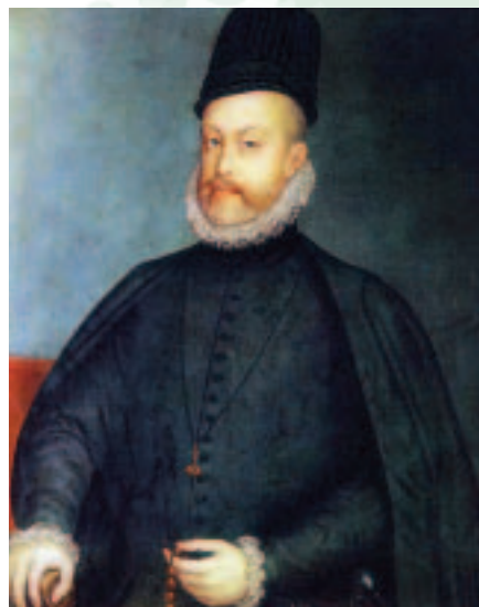
Felipe II, por Sánchez Coello. Con el gobierno de los primeros Austrias Bizkaia se sintió partícipe de la grandeza española. Son continuas las muestras de respeto a aquellos monarcas.