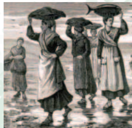
Ondarroa. Vendedoras de pescado (Imagen del siglo XIX, de Pannemaker).

qs. 4.730.944 del líquido de los tres años primitivos resulta de menos valor en los tres últimos años 64 qs. 8.240.104 maravedís de vellón".