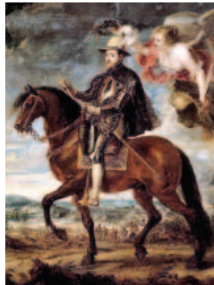
Felipe II, por Rubens.

A lo largo de su exposición Poza se permite manifestarse en desacuerdo con algunas ideas imperantes, como el concepto de hidalguía mantenido por Santo Tomás o Gregorio López para aportar el suyo propio.