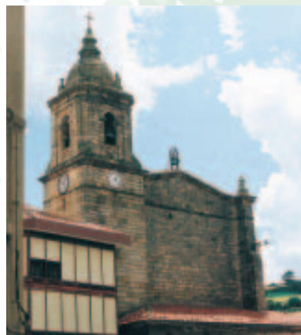
Bermeo, arriba iglesia juradera de Santa Eufemia. Imagen inferior: convento de San Francisco. Durante las revueltas habidas en las matxinadas los monjes salieron a la calle junto a los regidores para intentar apaciguar la ira del pueblo.

En los tres años desde henero de 1718, en que tubo efecto la plantificació de Aduanas hasta fin de Xbre. de 1720, tuvieron de valor las rentas adeudadas en Bilbao, San Sebastián y Yrun y las que se pusieron con motivo de la turbació de Bilbao en algunos pasos: 667 qs. 3.990.104 maravedís, y los gastos de Administrazió 35 qs. 7.490.260 maravedís y quedaron líquidos 631 qs. 6.490.840 maravedís de vellón que conferidos con los 696