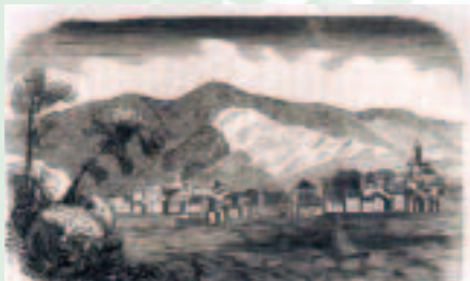
Bermeo, por J.A.

En Bermeo, como en Portugalete, se dio fuego al barco de aduana, y dos de los asesinados fueron el cabo y uno de los guardas de aquella embarcación.