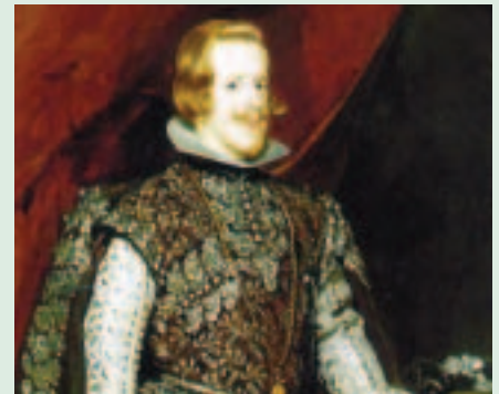
Felipe IV, por Velazquez.

Las interminables guerras, en especial el enfrentamiento con Francia iniciado en 1635 desgastaron una población ya diezmada por la demanda americana.