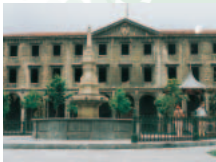
Urduña, edificio de la Aduana.

Inmediatamente el decreto se remitió al Señorío para que las aduanas se estableciesen en Bilbao y las de Gipuzkoa en Pasaia, Donosti y Ondarribia.