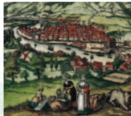
Bilbao en el siglo XVI (detalle), por Hogenberg.