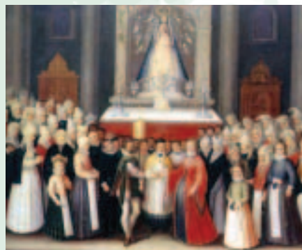
Boda en Begoña, por Francisco de Mendieta.

El discurso de Poza descansa en una idea fundamental: Bizkaia tiene leyes propias, juradas y confirmadas por sus señores, "independientes de las generales" del reino, con el que forma un "pueblo federado", porque conserva su estado primitivo y es, en consecuencia, libre.