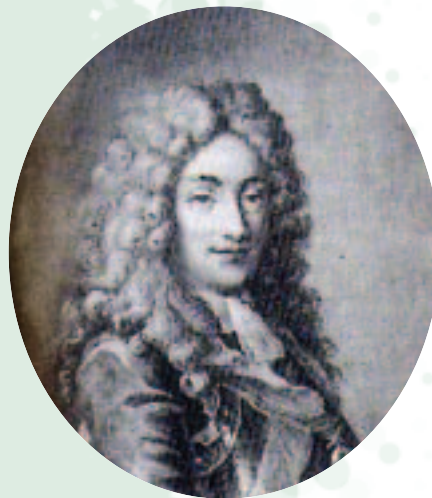
James Fitzjames, duque de Berwick.

La respuesta de la Diputación es breve: "...corresponderá mi respetuosa obligación, embiando mañana Diputados que pongan a los pies de V.A. y acrediten mi veneración y rendimiento al Señor Rey cristianísimo y a sus armas..." Tolosa 3 de Agosto de 1719.