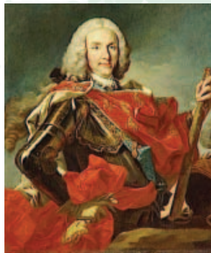
Felipe V, por Van Loo.

La centralización política y administrativa caracterizó el reinado de Felipe V. Los Decretos de Nueva Planta abolieron de hecho los fueros valencianos y aragoneses.