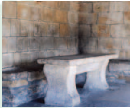
Galdakao. Mesa de juntas en Andra Maria.

10ª. Presentación de documentos. (Entre otros, la carta de Felipe III)