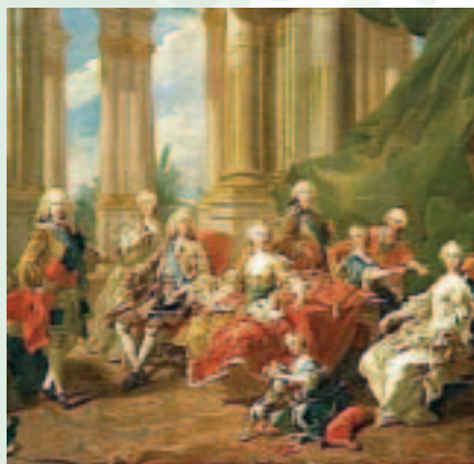
Felipe V y su familia, por Van Loo.

"se supone que avra alguna resistencia u dificultad por los fueros, pero si la hubiese se puede subsanar sin tocarlos sino solo mandándose por el rey que todas las Lanas de Castilla no se puedan sacar por los Puertos de Vizcaya sino por el de Santander hasta el qual pueden llegar las carreterías de cuiá Providenzia darían grazias los Yngleses, pero los vizcainos por no verse privados del Util de las comisiones que les Dexa el paso de las Lanas consentirán Luego el establecimiento de las Aduanas en sus Puertos por cuió motivo Conviniera mandarlo desde luego y Usar de la Vuestra Providenzia si se resistiesen..."