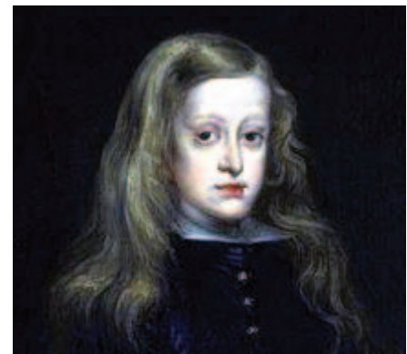
Carlos II, por Carreño de Miranda.

Carlos II murió sin descendencia de dos matrimonios. La cuestión de la sucesión, entre dos posibles candidatos, el Archiduque Carlos, nieto de Felipe III, y Felipe de Anjou, biznieto de Felipe IV, dio origen a la guerra de sucesión.