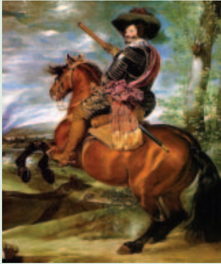
El Conde-Duque de Olivares, por Velázquez.

La sanción real se dio en Madrid a 3 de Enero de 1632.